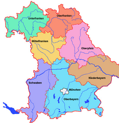
Übersicht 1: Regierungsbezirke im Bundesland Bayern

Am 01.12.2015 waren in der V-DKN-Datenbank noch 4419 „Objekte“ erfasst.